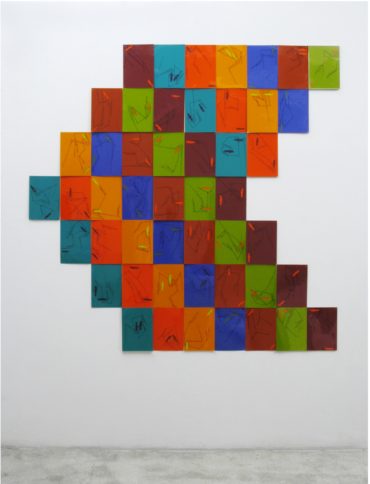
Francesco Candeloro – Directions (Free 6) – Decoupage and marker on acetate, paper and plexiglass – cm. 29, 7 x 21 x 6 (closed artwork) / cm. 210 x 208 (open artwork) – 2006