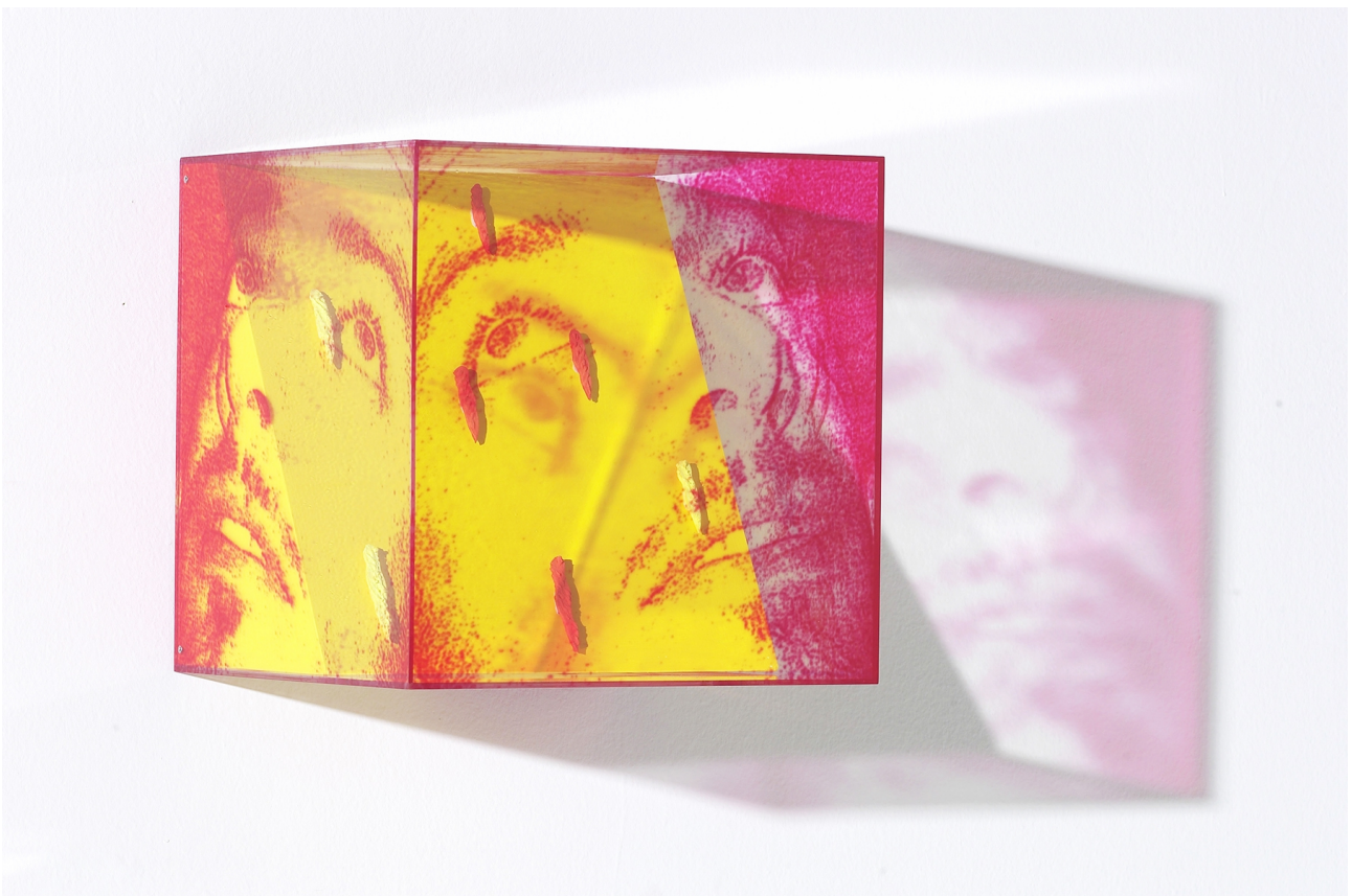
Francesco Candeloro – Eyes 7 – Industrial airbrush on plexiglass / Mixed technique – cm. 42 x 42 x 42 – 2004