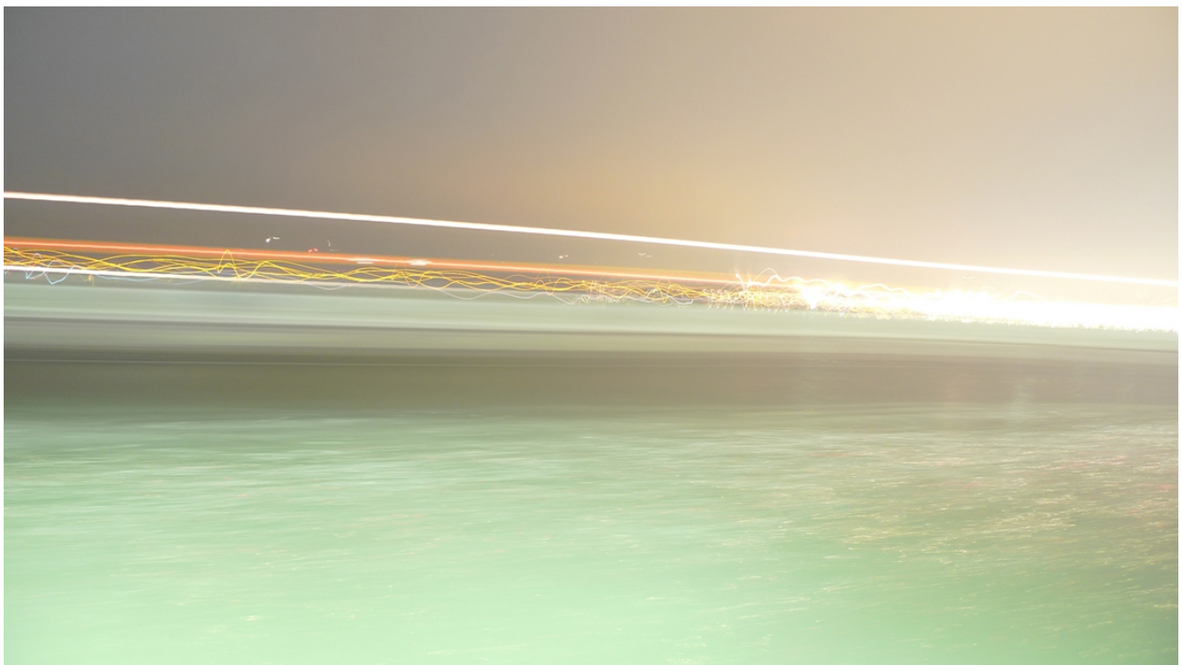
Francesco Candeloro – Times of the Light Venice v2 – Lambda print on photographic paper - cm. 40 x 23 – 2015

Opmerking op Afbeeldingen: neem contact met press@redstampartgallery.com om meer foto's of om de hoge resolutie versie te vragen